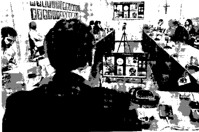
Desde a criação do Conselho, foram aprovados incentivos fiscais para cinco empresas

Os benefícios concedidos pelo Governo de Alagoas são gerados a partir do Programa de Desenvolvimento Integrado (Prodesin) que em 2016 setou uma modernização e passou a oferecer a redução de 90% no pagamento do Imposto sobre Serviços (ICMS) nos setores de Serviços Industriais, Comércio e também diferenciamen-