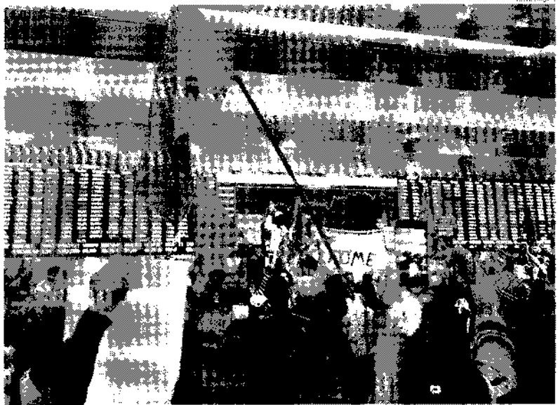
Manifestantes ocupam a Bolsa de Valores de São Paulo em protesto contra o desemprego e a inflação em 2021.

Alguns dos participantes levantaram bandeiras com o lema "Sem inflação não há crescimento". Outros seguravam faixas com o texto "Inflação de 10,47% em agosto, segundo o IBGE".